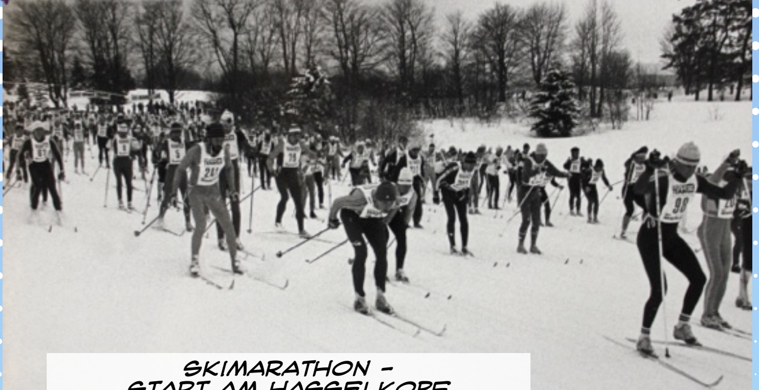
SKIMARATHON - START AM HASSELKOPF BEMERKENSWERTE TEILNEHMER ANZAHL