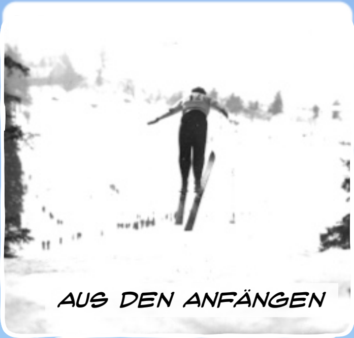
AUS DEN ANFÄNGEN