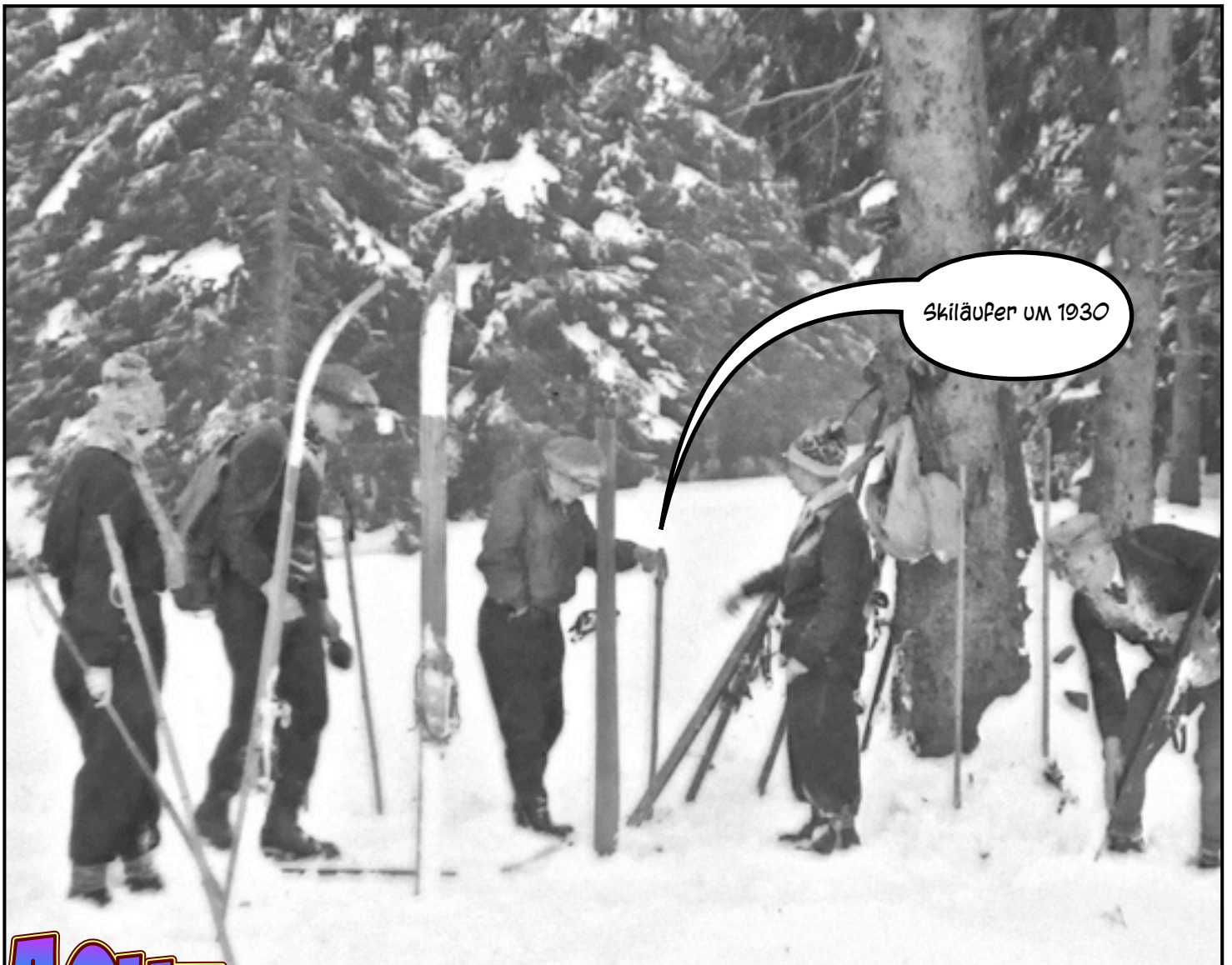
Skiläufer um 1930