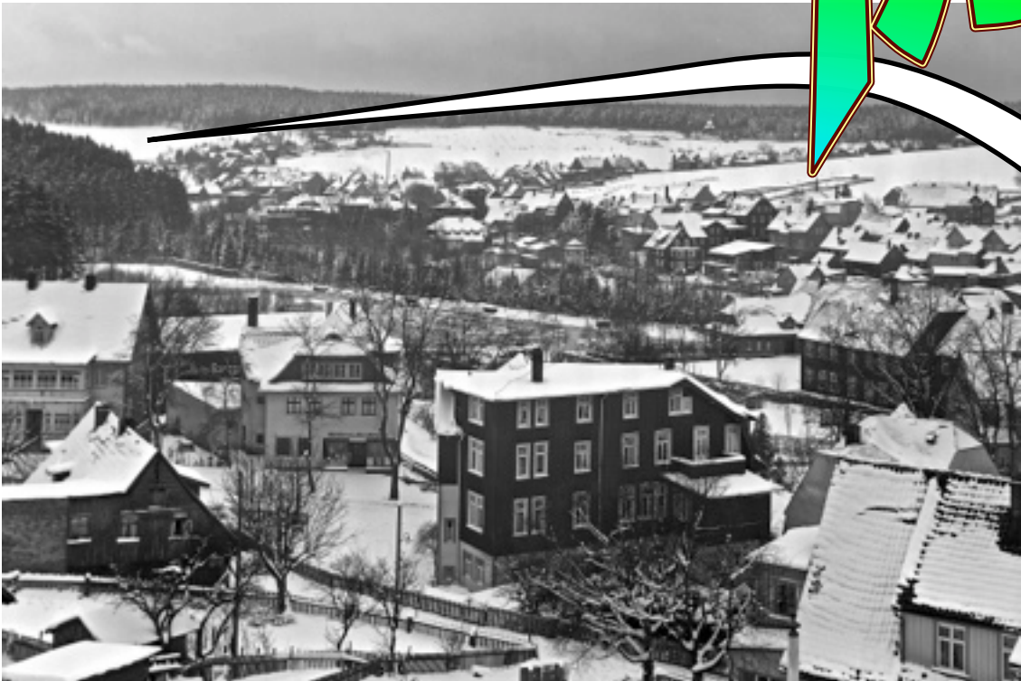
BLICK ÜBER DEN KURPARKTEICH ZUM HASSELKOPF